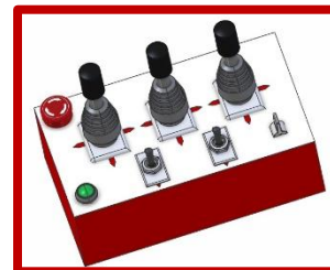
Καλωδιακό χειριστήριο Joystick / 3