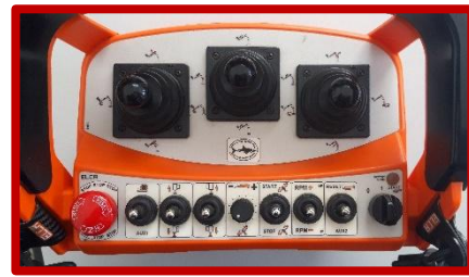
Ασύρματο χειριστήριο τύπου 1A